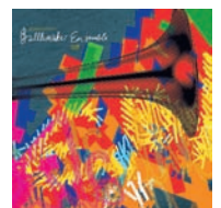
Ballbreaker Ensemble Töff