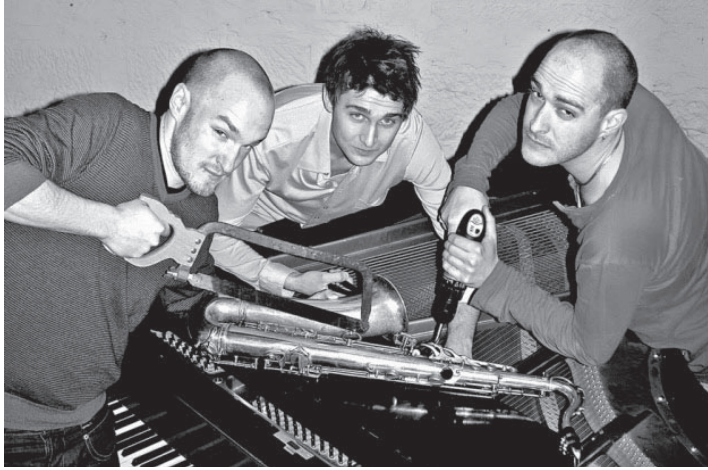
Hand anlegen am guten alten Jazz: die Initiatoren der ersten Berner Jazzwerkstatt.