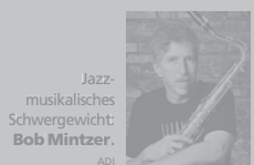
Jazzmusikalisches Schwergewicht: Bob Mintzer.

Mittwoch » ALEC EMPIRE Dachstuhl Reitschule 21 Uhr. Der digitale Tunichtgut stellt sein neues Album vor. » CULCHA CANDELA Bierhübli, 20 Uhr. Bei Stefan Raabs Songcontest noch in die Ränge verwiesen, macht sich die Berliner Ragga-Combo auf, die Welt zu erobern. » THE HEAVY Fri-Son Freiburg, 21 Uhr. Das Quintett aus England bietet herzergreifenden Soul vermergt mit Stromgitarren und hitzigem Funk. (ane)