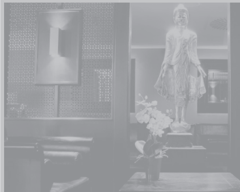
Volksnahe Gemütlichkeit: der Wankdorf-Club.

WANKDORF-CLUB im Stade de Suisse. Eröffnungsparty mit Djs Sir Colin, Christopher S. und anderen. Do, 21. Februar, 21 Uhr. www.wankdorf-club.ch